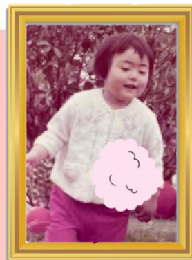
地域のお祭りで駆け回る